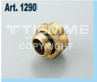
Raccordo per connessione derivazioni Fittings for outlets connection