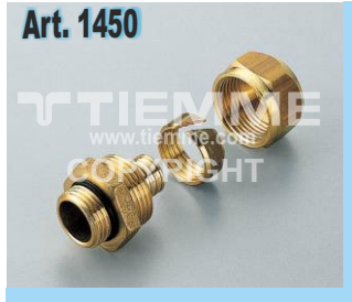
Raccordo per connessione derivazioni Fittings for outlets connection